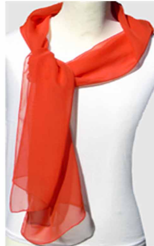
Art. S-777-orange Maße 35 x 170 cm

Unsere zweifarbigen Schals kombinieren Sie mit Ihren selbst gewählten Farben aus unserer Farbpalette. Gerne senden wir Ihnen hierzu Muster zu.