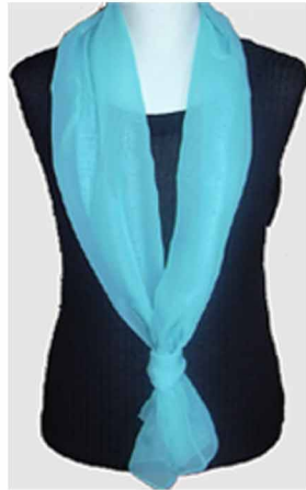
Art. S-777-türkis Maße 35 x 170 cm

Leichte Schals aus feinem Chiffon Art.Nr. 777. Jetzt mit neuen Farben und verschiedenen Möglichkeiten überzeugen Sie sich selbst.