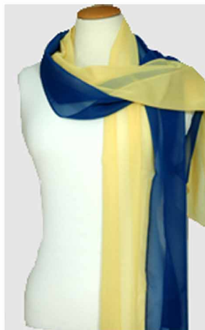
Art. Anna, zweifarbig Farbe: blau / gelb Maße 40 x 170 cm