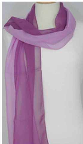
Art. Anna zweifarbig Farbe: lila / hell lila Maße 40 x 170 cm

Unsere zweifarbigen Schals kombinieren Sie mit Ihren selbst gewählten Farben aus unserer Farbpalette. Gerne senden wir Ihnen hierzu Muster zu.